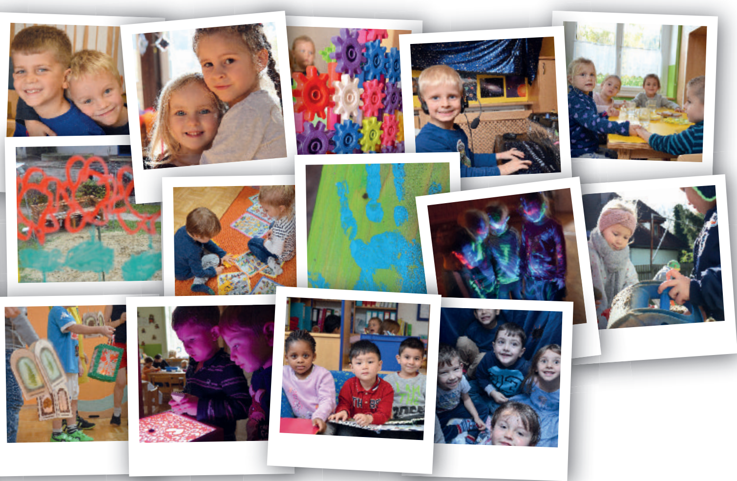
Walfersam * Redfeld * Hochschwabsiedlung * Parschlug